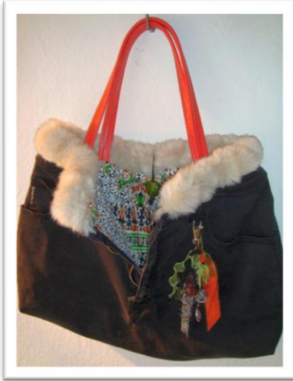
5 ème Prix