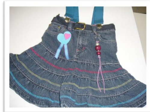
8 ème Prix