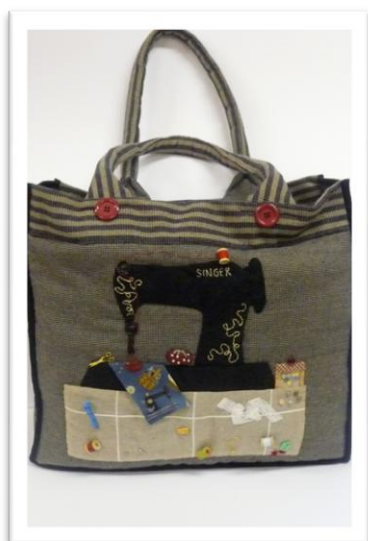
3 ème Prix