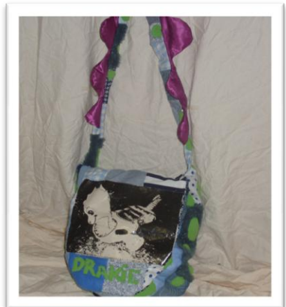
9 ème prix