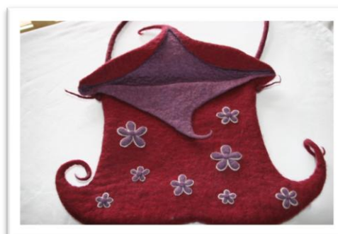
2 ème Prix