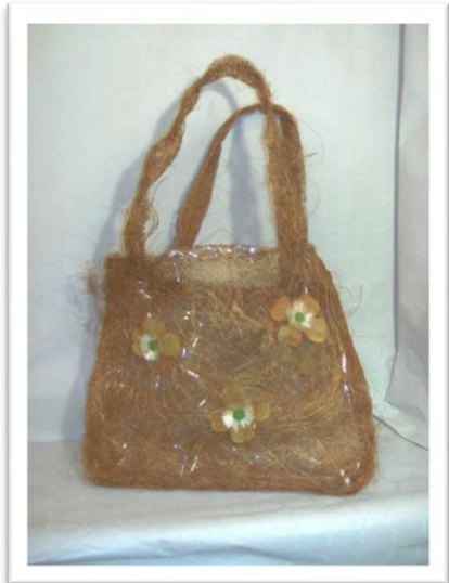
7 ème Prix